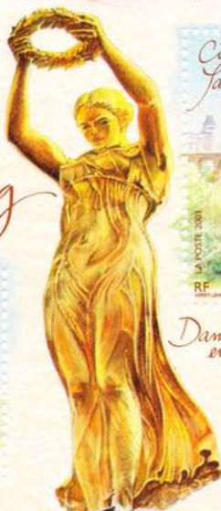
Dame en or