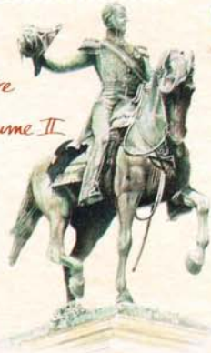
Statue équestre de Guillaume II